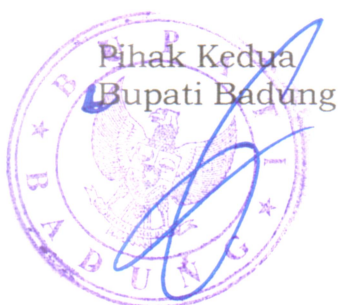
I Nyoman Giri Prasta

Pihak kedua akan melakukan supervisi yang diperlukan serta akan melakukan evaluasi terhadap capaian kinerja dari perjanjian ini dan mengambil tindakan yang diperlukan dalam rangka pemberian penghargaan dan sanksi.